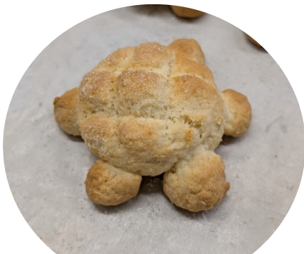
メロンパン風クッキー

2月は「水瓶座」がテーマです。なかなか思いつかず、「瓶（かめ）＝亀（かめ）」と無理やり結び付け、おやつを亀の形にしてみました 🍪 鉄板に亀が沢山並ぶ姿は可愛かったですよ♡