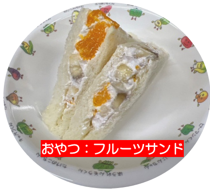
おやつ：フルーツサンド

今年度は「星座」をテーマに誕生会メニューを考えました。5月の星座は「牡牛座」です。