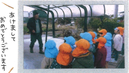
おけまして おさんぽ日和

おさんぽ日和 ☺ この日は堤防までおさんぽ! 徳太郎さんにも会い、新年のご挨拶をしました♪