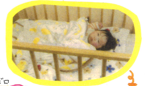
マットでゴロゴロ たいしー