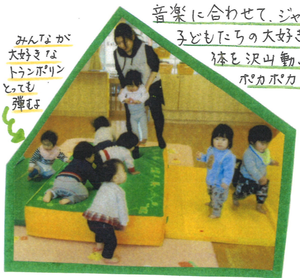
みんなが大好きなトランポリンとても弾む