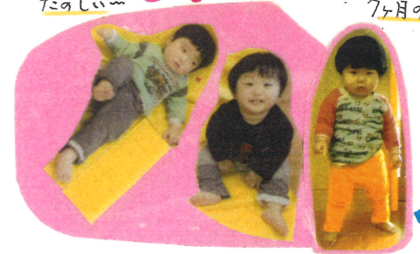
早く一緒に遊びたいな~ アンヨが出来るようになったヨ!