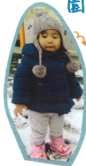
まっ白な雪の上を元気に歩いたり、走ったりしたよ♪