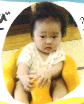
クラスで一番小さいちゃんパンボに座って遊びに参加したよ

9名全員が揃った日、布つみきで遊んだよ。軽くて、色々な形があるよ。皆で、高く積み重ねて遊べるようになったら、もっと楽しいネ!!