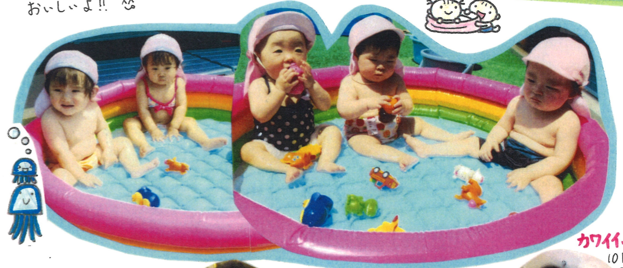
カワイイ～ 10月生まれの子